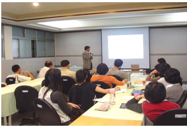
曲先生從個人經歷開始談起