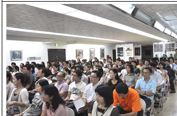
台下老師們專心聆聽