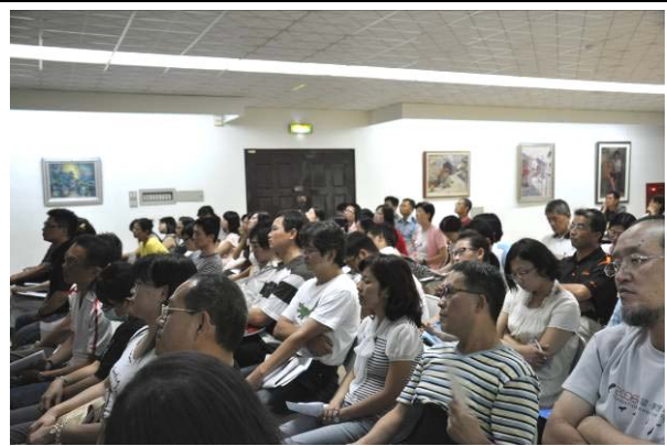
台下老師們專心聆聽