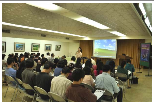
美工科、廣設科專任教師及 校外(1名)與會老師