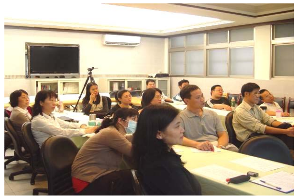
台下老師專心聆聽