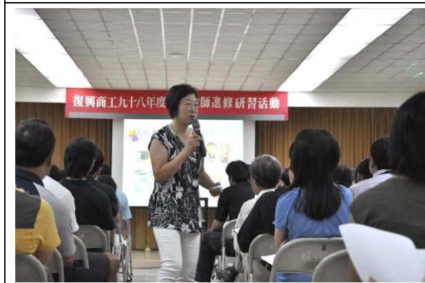
高教授走動式教學