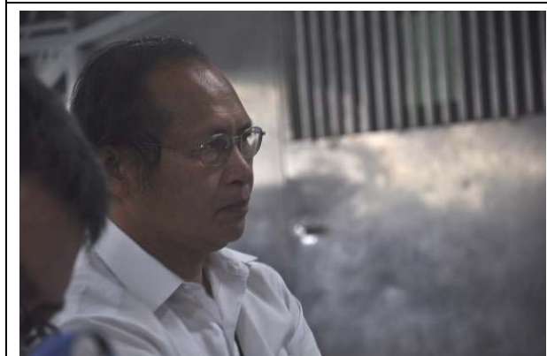
與會老師專注的神情