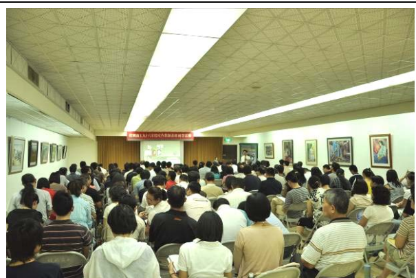
所有專、兼任與會老師