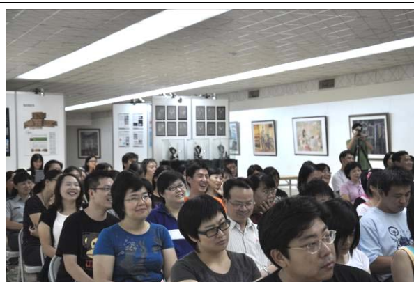
台下老師開懷大笑