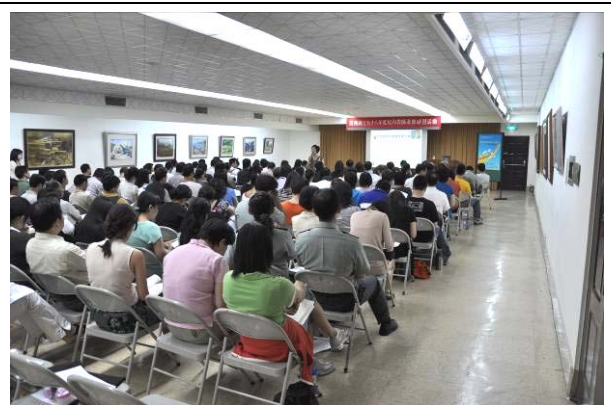
所有專、兼任與會老師