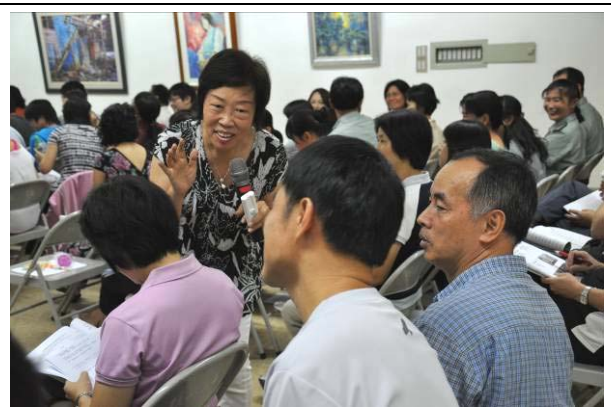
高教授與老師們互動