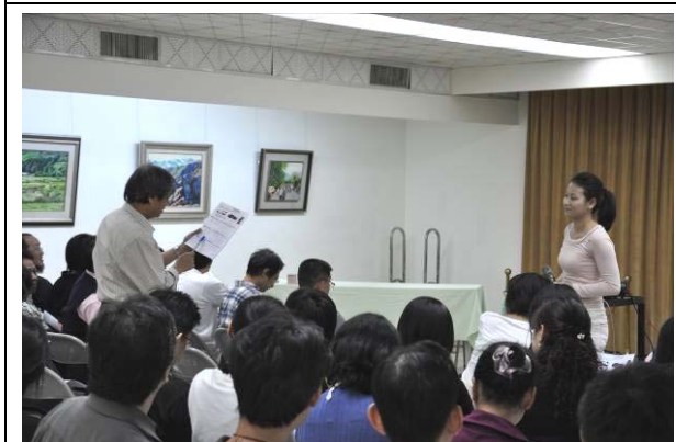
講師與老師們互動