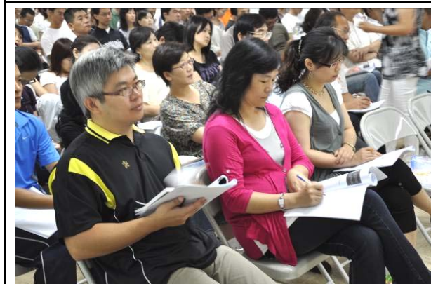
台下老師們專心聆聽、勤作筆記