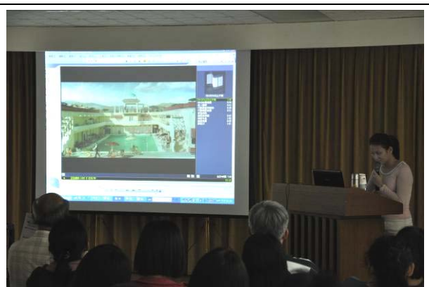
精彩豐富的演講內容