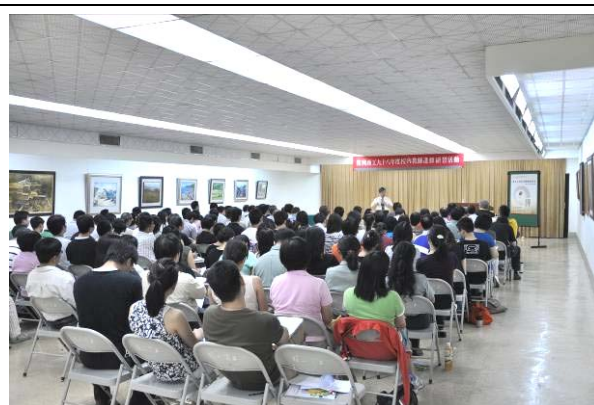
所有專、兼任與會老師