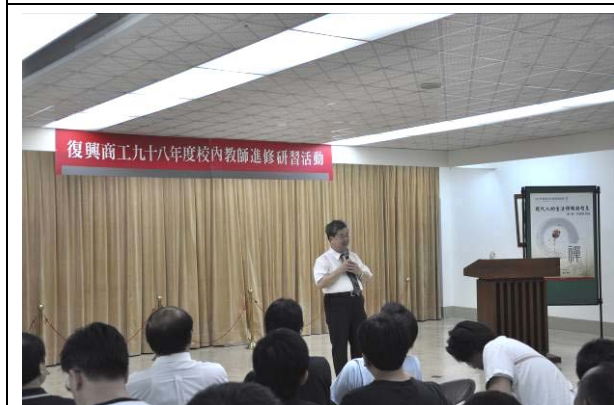
徐先生開始幽默風趣的演講