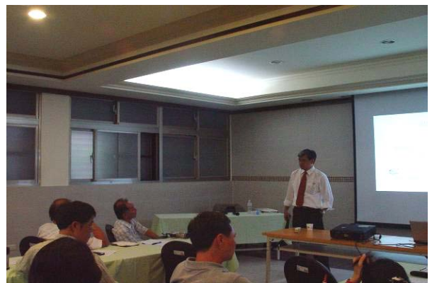
老師們踴躍發言，請教曲協理實務經驗